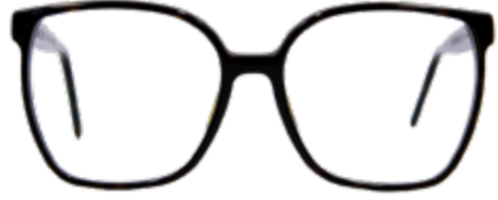
WÖRTHERSEE Volltreffer! Bühne frei für die 70er Jahre. Die weiten, quadratischen Rahmen passen perfekt zu jedem Retro-Look.

Die Marke ist made in Austria, trotzdem im heimischen Markenvergleich preiswert. Jeder Kauf einer Scharfsinnfassung stärkt eigenständige, unabhängige Optikerbetriebe und belebt auch die heimische Wirtschaft.