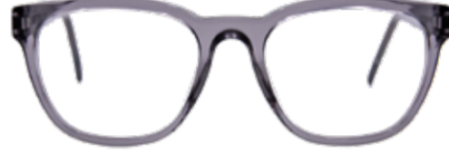
MUR Alles im Flow – der fließende Übergang in die ovale Form harmonisiert mit rundlichen wie eckigen Gesichtern.

KOSTENLOSER SEHTEST Wir bieten Ihnen einen kostenlosen Sehtest mit fachkundiger Beratung, damit Sie immer mit den richtigen Gläsern unterwegs sind. Unabhängig vom Sehtest sollte eine regelmäßige Überprüfung des allgemeinen Gesundheitszustandes der Augen bei einem Augenarzt erfolgen.