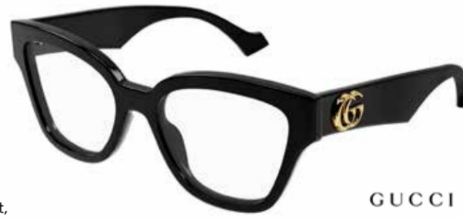
GUCCI Mit voller Wucht! Ein breites Bügeldesign demonstriert Selbstbewusstsein und verleiht pures Luxusgefühl.