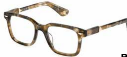
POLICE Buongiorno! Exklusives, marmoriertes Acetat trifft auf markante Proportionen in italienischem Flair.